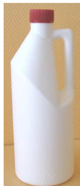
conditionnement unique en flacon de 1 litre à anse avec bouchon sécurité enfant code A33

NOTA : Préventivement et périodiquement, afin d'éviter le risque d'obstruction par formation progressive de dépôts qui freinent l'écoulement, verser en fonction du type et de l'importance de l'évacuation à traiter, un volume de 1/4 à 1/2 litre de déboucheur. Dans le cas d'immeuble à étages, commencer l'application TOUJOURS par les étages inférieurs.